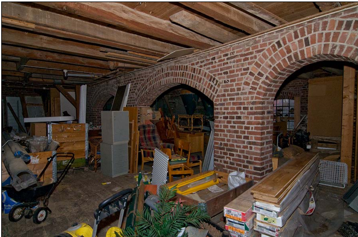
Magasins- och kvarnbyggnaden då och nu. Bottenvåningen. Murade stödvalv om 1,5 stens bredd bär upp ovanvåningen. Konstruktionen med längsgående stöd under långa golvbjälkar är tidigmedeltida. Byggnaden från sent 1800-tal har haft flera användningsområden: magasin, lantmannaaffär, madrassfabrik och kvarn. Senast användes byggnaden som kvarn. Överst: Från madrassstillverkningens dagar finns ett foto bevarat, från åren strax före 1920-talet, tidigast 1915. Av bilden att döma rörde det sig om en hantverksmässig tillverkning av madrasser. Underst: magasinets bottenvåning är i dag belamrad med föremål.