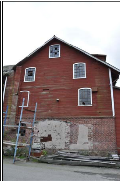
Magasins- och kvarnbyggnad från slutet av 1800-talet. Funktionell bruksarkitektur i tegel och trä. Överst: detalj av gjutjärnsfönster i bottenvåningen. Naturstensgrunden är typisk för Höör.