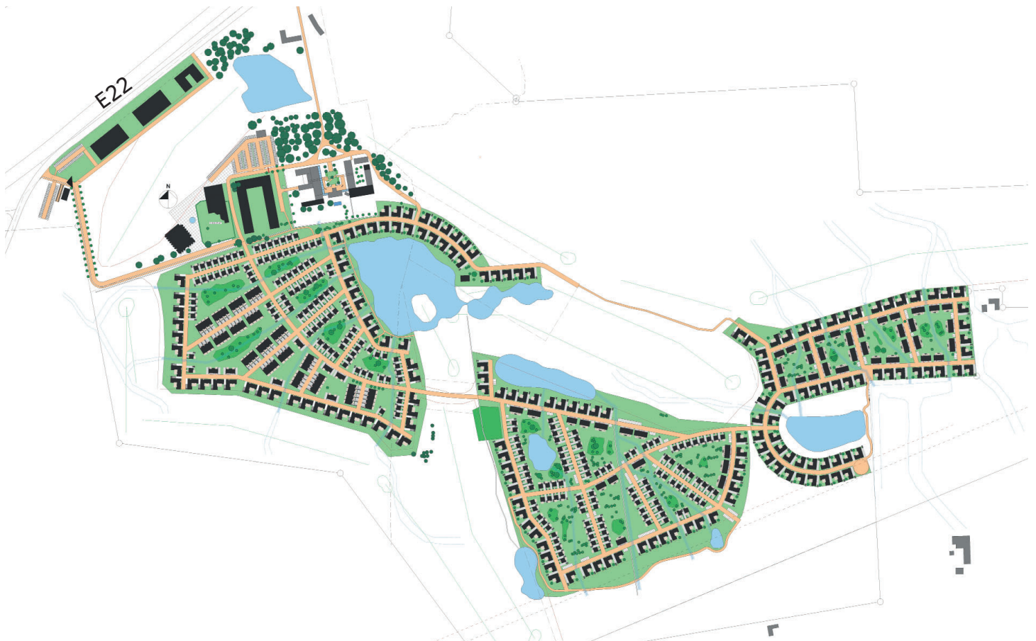
Utdrag ur planprogrammet. Illustrationen visar visionen för den framtida utbyggnaden av "Elisefarm".