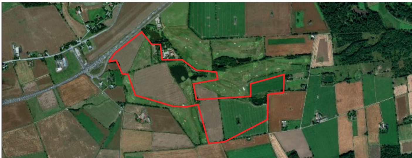
Programområdets lokalisering och ungefärliga avgränsning

I planprogrammet står det gällande naturvärdesinventeringen att: Till samråd för kommande detaljplan behöver det tas fram en uppdaterad naturinventering enligt gällande svensk standard (sidan 19 och sidan 28). Skrivningen är inaktuell då det inför samrådet har inkommit en uppdaterad naturvärdesinventering vilken uppfyller kraven enligt gällande svensk standard.