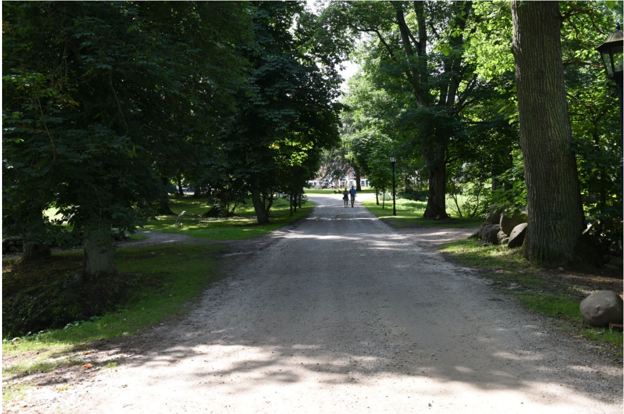
Allén till huvudgården