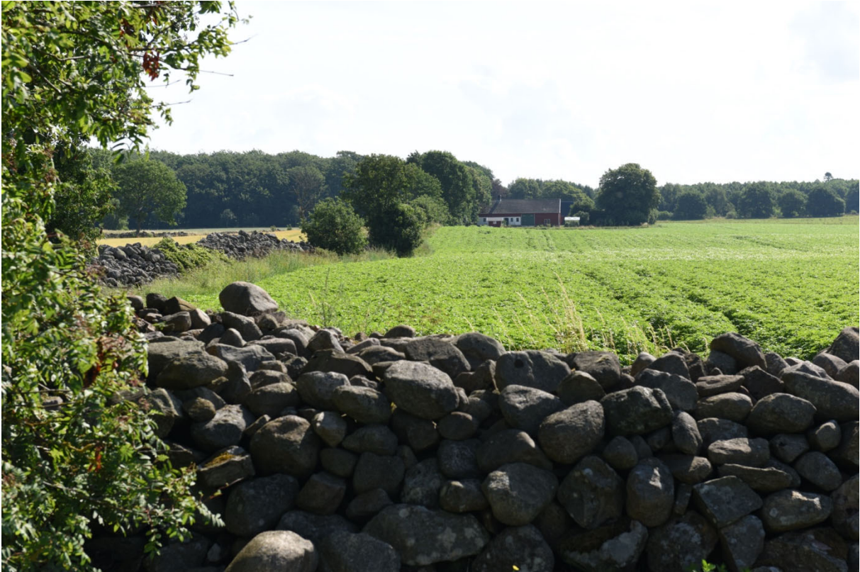
Vy från Elisfarm med stengärdsgårdar och ensamliggande byanläggning.