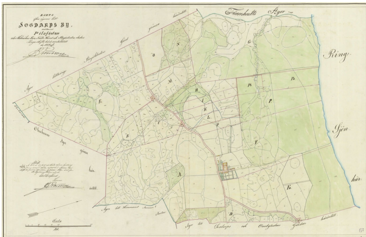
Skifteskartan över lagaskifte öfver Fogdarp by samt hemmanet Pilafästan daterad 1856 visar att området kring dagens Elisefärm är uppbruten jordbruksmark, åker och äng, och i princip saknar bebyggelse.