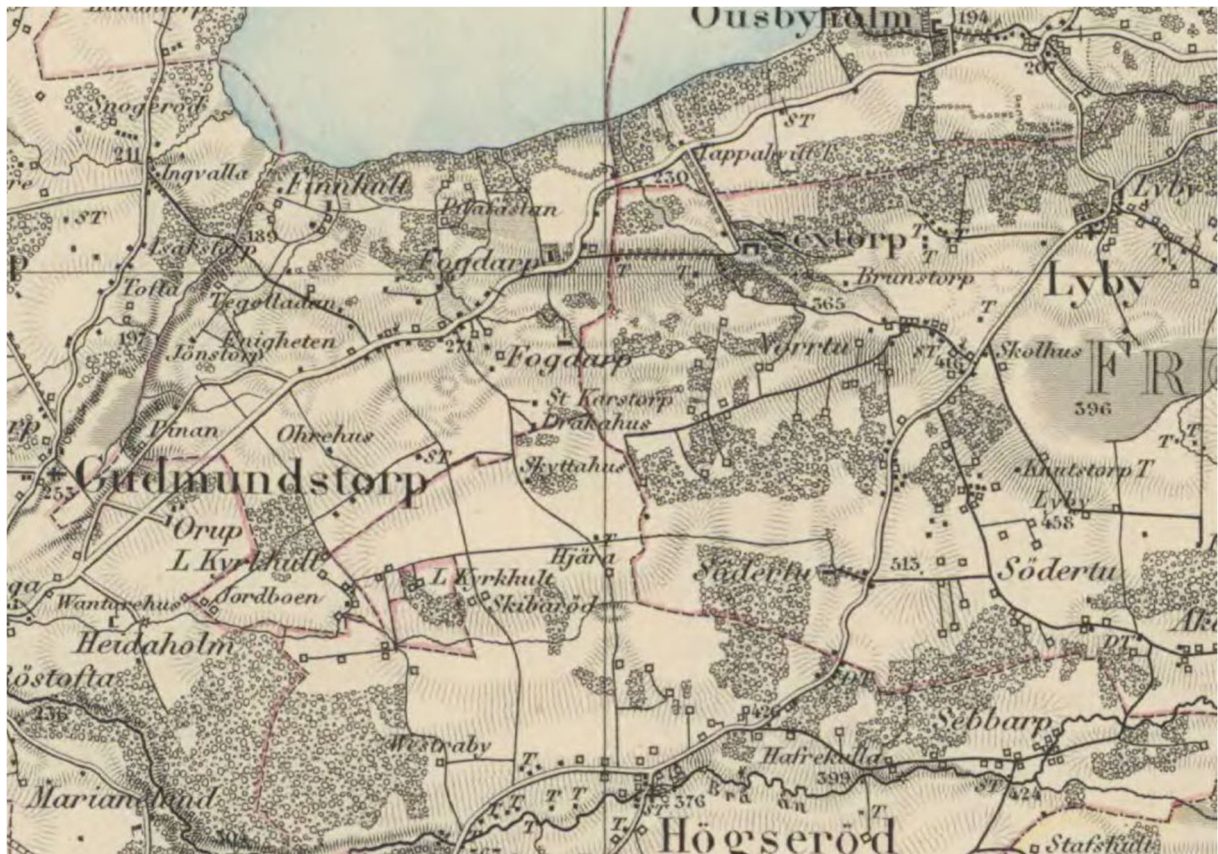
Generalstabens karta från 1865 visar stor likhet med dagens bebyggelsemönster. De sedan länge etablerade byarna ligger kvar. Förtätning har skett av ensamliggande gårdar. Särskilt har bebyggelsen tätat utmed de stora vägarna. Kulturlandskapet präglas av åkermark, ängar och skogbevuxna områden med bok och ek.