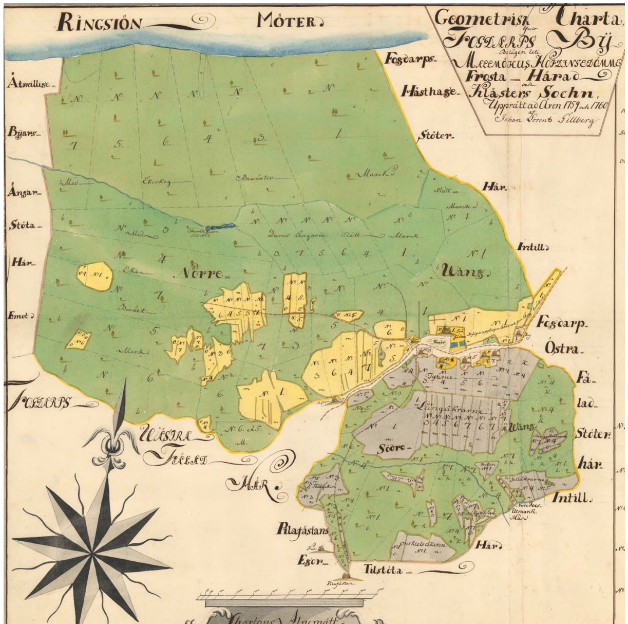
Geometrisk avritning av Fogdarp by 1759 vittnar om att nyodlingen ökat, något som antagligen beror på jordbrukstekniska innovationer. Dessvärre har inte någon motsvarande karta påträffats för ägorna kring dagens Elisefarm. Det framgår emellertid att det i närområdet finns ett par ensamligande gårdar däribland Pilafästan. Av inskriptionen på kartan framgår att landskapet delvis är bevuxet med lövlandskog främst bok och ek.