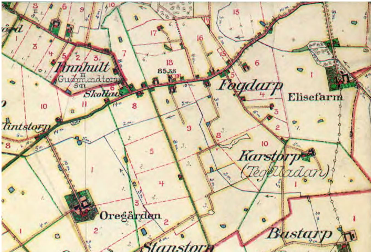
Häradskartan daterad 1910 visar att gårdsanläggningen Elisefarm har etablerats och att huvudbyggnaden gestaltats som en mindre herrgård omgärdad med park. Till huvudbyggnaden leder en allé. Av kartan framgår vidare att bebyggelsen förtäts så att kulturlandskapet, som är tryfflerat av glest liggande ensamgårdar, har ändrat karaktär till öppen fulläkersbygd. Bebyggelsen har även tätat utmed vägsträckan Finnshult - Fogdarp.