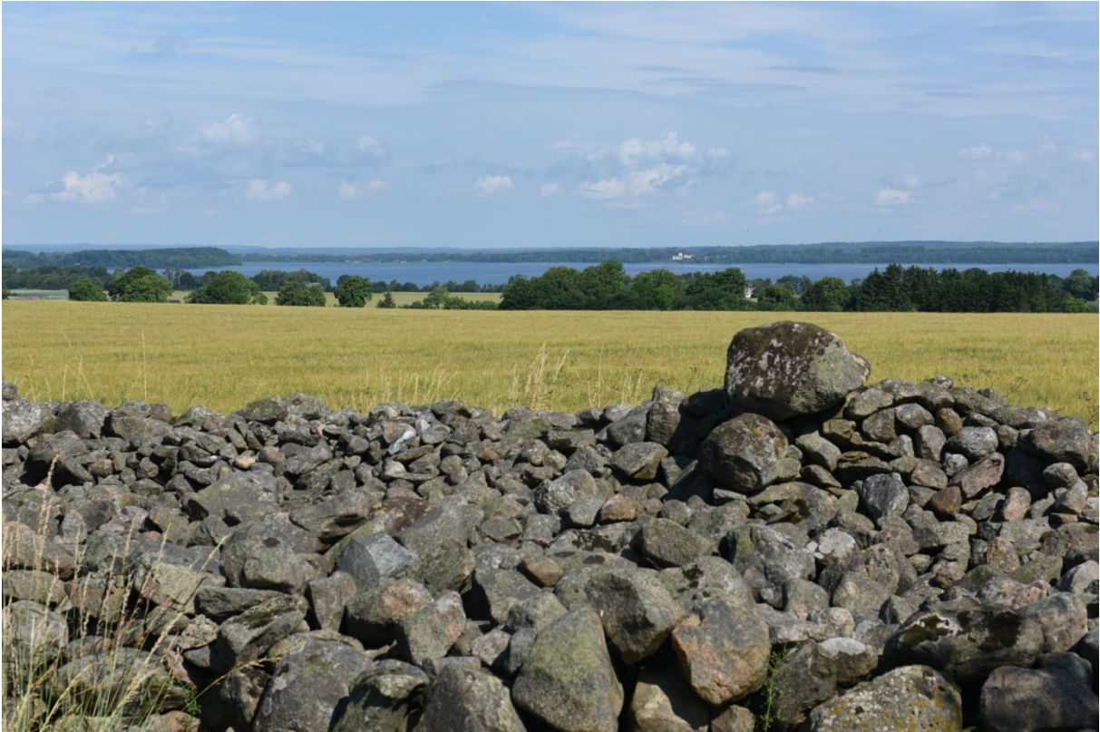
Landskapets långa och vida siktlinjer. Vy från Elisefarm mot Ringsjön och Bosjökloster