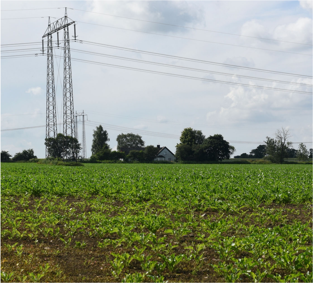
Vy från Elisefarm mot ensamliggande gårdsanläggning.