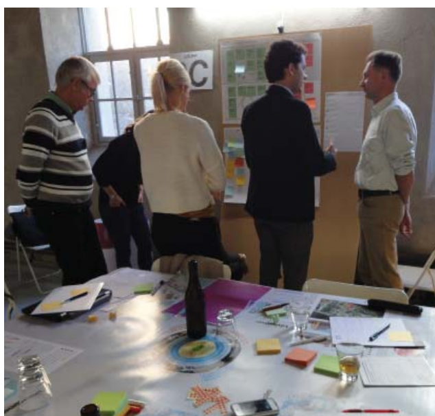
Exempel från en workshop i medborgardialogprocess.

Nackdelen är att resultatet ger en bild av de medverkande barnen, helt fokuserat på den egna närmiljön, snarare än på allmänhetens behov. Risk finns för att åtgärder sätts in på “fel” ställe då deltagarna inte kan bidra med en helhetssyn som bygger på en jämförelse av de kritiska platserna. Risk finns även för gruppträck.