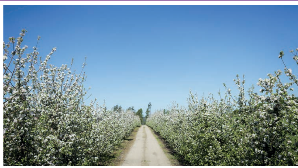
Apple orchard at Källgården apple farm