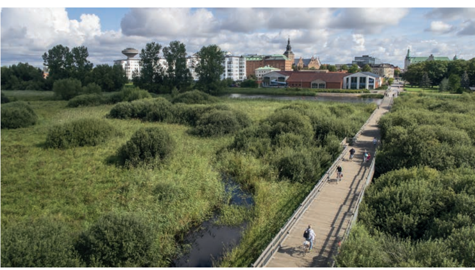
Kristianstads Vattenrike Naturum