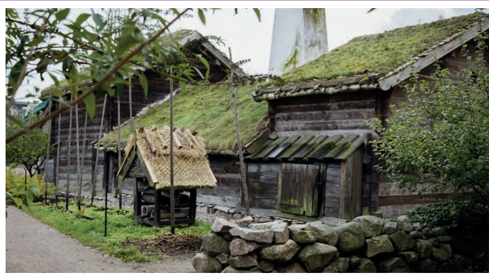
Old houses at Kulturen in Lund